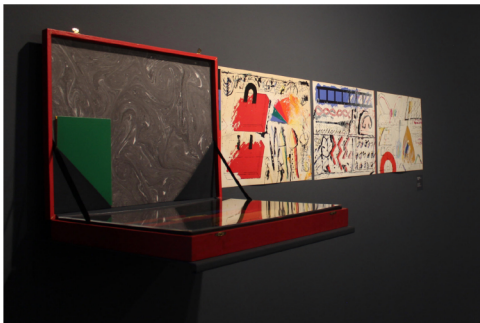
Imatge de sala de l'exposició a "Espai Llibres" a l'ACVIC. El llibre de la pluja-caixa de Frederic Amat i Joan Brossa.

En bona part dels llibres exposats, Amat estableix un diàleg amb altres poetes i escriptors. Justament una de les peces més antigues que es mostren és el Llibre de la pluja-caixa , que nesqu fruit de la correspondència amb Joan Brossa i que s'acaba formalitzant en una caixa plena d'objectes escenogràfics per fer màgia o generar representacions. Conjuntament amb Brossa també publicà Tal i tant , una peça sorgida del repte d'il·lustrar poesia i que implicaria un primer pas en el treball entre el contingut (el text) i el continent (el dispositiu-llibre).