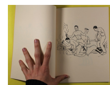
14 Al Capp, The Short Life and Happy Times of the Shmoos .