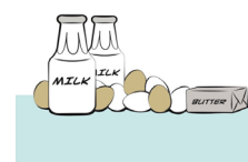
16 Adams, Carol J. (2020) The Pornography of Meat , Bloomsbury.